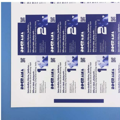
Druckbogen mit Druckmarke

Bei Abweichungen vom Druckbild zur Bogenvorderkante kann ein Druckmarkenleser eingesetzt werden. Dieser erfasst die Position der Druckmarke und korrigiert in Laufrichtung. Passerdifferenzen können so eliminiert werden.