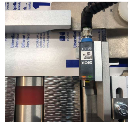
Der Sensor hat die Druckmarke erfasst, allfällige Differenzen werden ausgeglichen