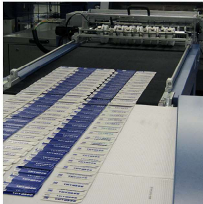
Direkte Übergabe der Produkte zum Spreizband