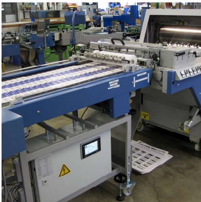
Schuppenband SB 550 im Anschluss an BSR 550 Servo mit neuer Ausbrecheinheit